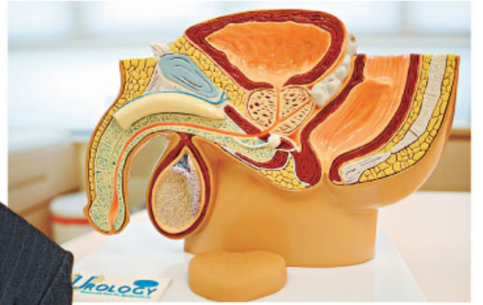
前列腺負責製造濃液混和精子形成精液，一般於三十歲後開始出現組織增生，影響排尿。

他表示，前列腺肥大可引致併發症，如急性尿儲留、膀胱石、膀胱炎、前列腺炎，甚至較嚴重的腎功能衰退。「有中度至嚴重徵狀的患者會有兩成機會出現急性尿儲留併發症，患者因前列腺阻塞，突然不能排尿，但小便一直從腎臟流入膀胱，令膀胱不斷脹大，導致痛楚。」他提醒各男士，如感小便困擾或有懷疑，應盡早求診接受治療。